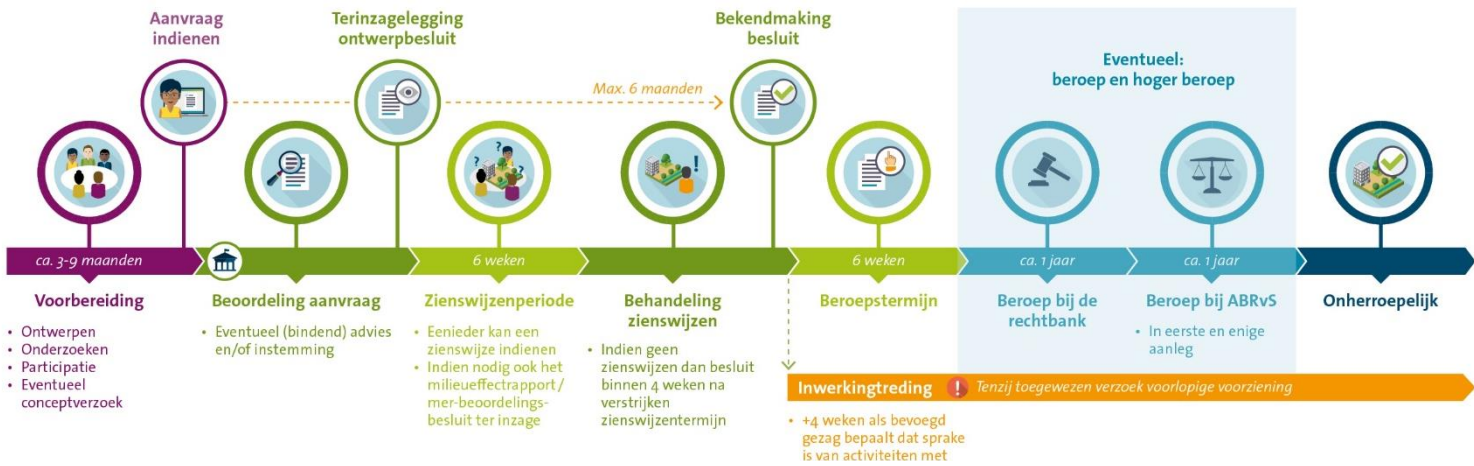
Figuur 0-1: Procesverloop uitgebreide procedure onder de Omgevingswet.